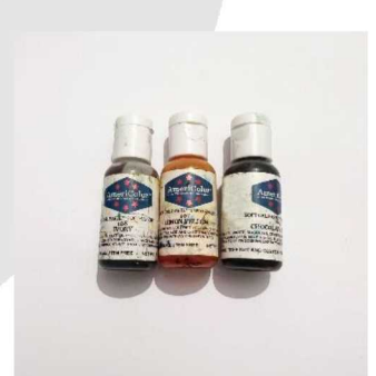
رنگ ژله ای