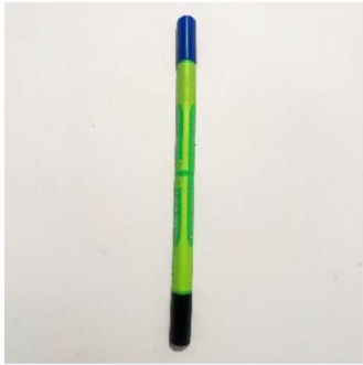
ماژیک سی دی